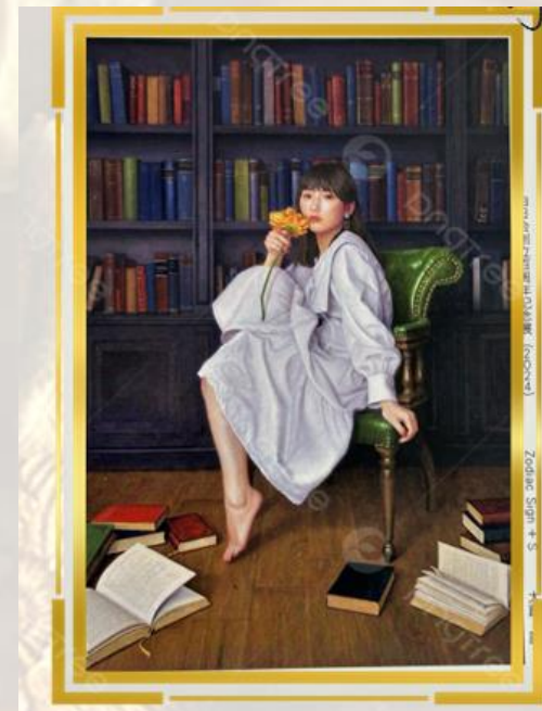
「Zodiac Sign + S」 P100号